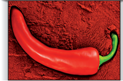
chilli guindilla, chile