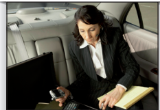
government minister ministro/a