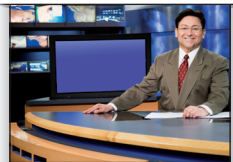
newsreader presentador/ora de informativos