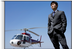
business tycoon magnate