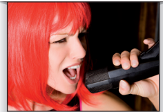
rock star estrella de(l) rock